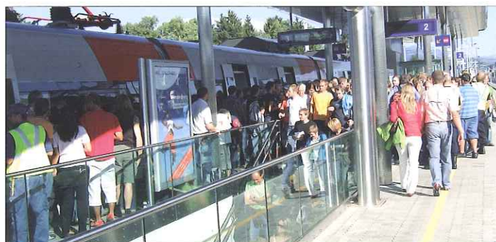
Die neue S-Bahn-Station Salzburg Taxham ist ein Publikumsmagnet für Schüler, Stadion- und Europarkbesucher.